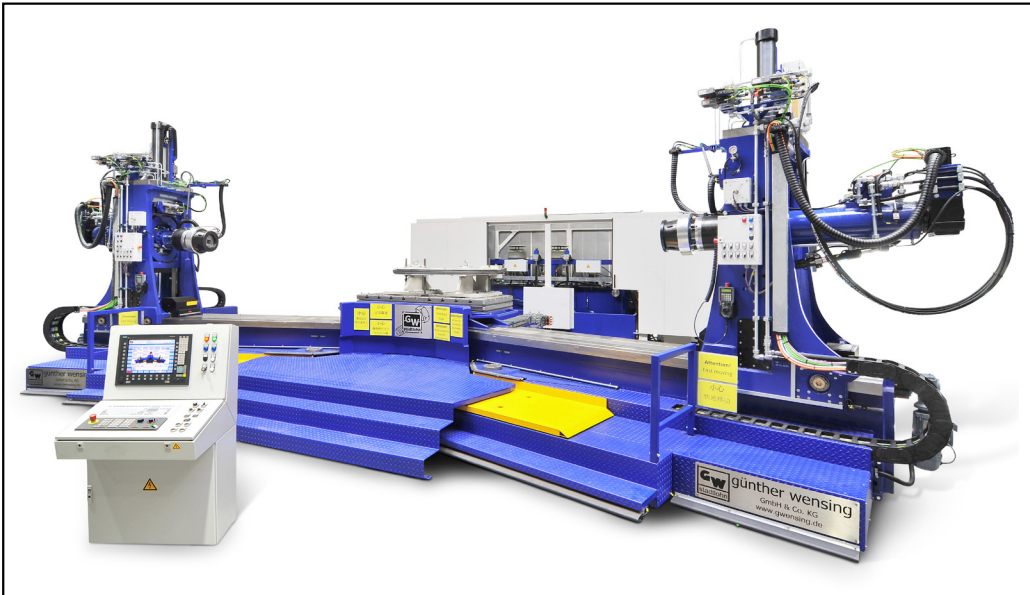
Abb. 1: CNC-Streckbiegemaschine steuern